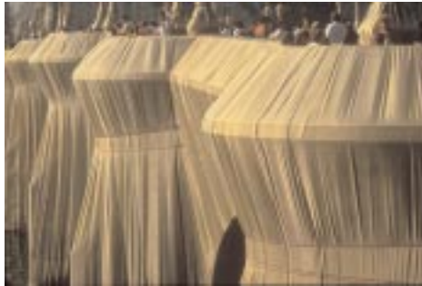
Christo & Jeanne-Claude

Concluí o projeto uma noite, quando estava no bar “Birinites”. A percepção daquele espaço e do público que o frequenta contribuiu para finalizar a idéia da performance. Assim, marquei com o dono do local uma data para apresentação.